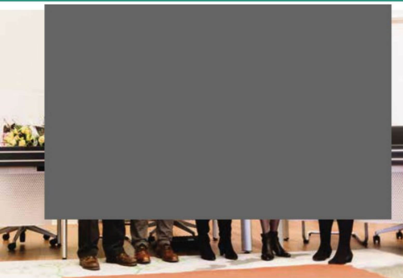
Deze foto is van de eerste uitreiking Fairtradegemeente in 2019

De landelijke jury van de campagne Fairtrade Gemeente heeft de titel voor Hof van Twente verlengd. Dat betekent dat Hof van Twente zich ook in 2021 en 2022 met trots Fairtrade Gemeente mag noemen. Dit is het resultaat van goede samenwerking tussen kernteam Fairtrade Hof van Twente, de gemeente en natuurlijk veel ondernemers, instellingen en organisaties die Fairtrade in de Hof ondersteunen. Fairtrade streeft eerlijke handel na waarbij boeren en arbeiders in ontwikkelingslanden een betere plek krijgen in de handelsketen.