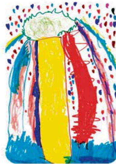
Zwembadboom van Roos