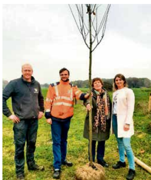
Boom voor zorgboerderij Klein Exterkate