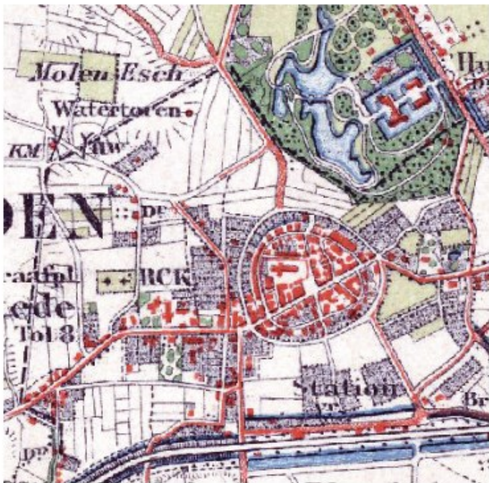
Delden in 1903