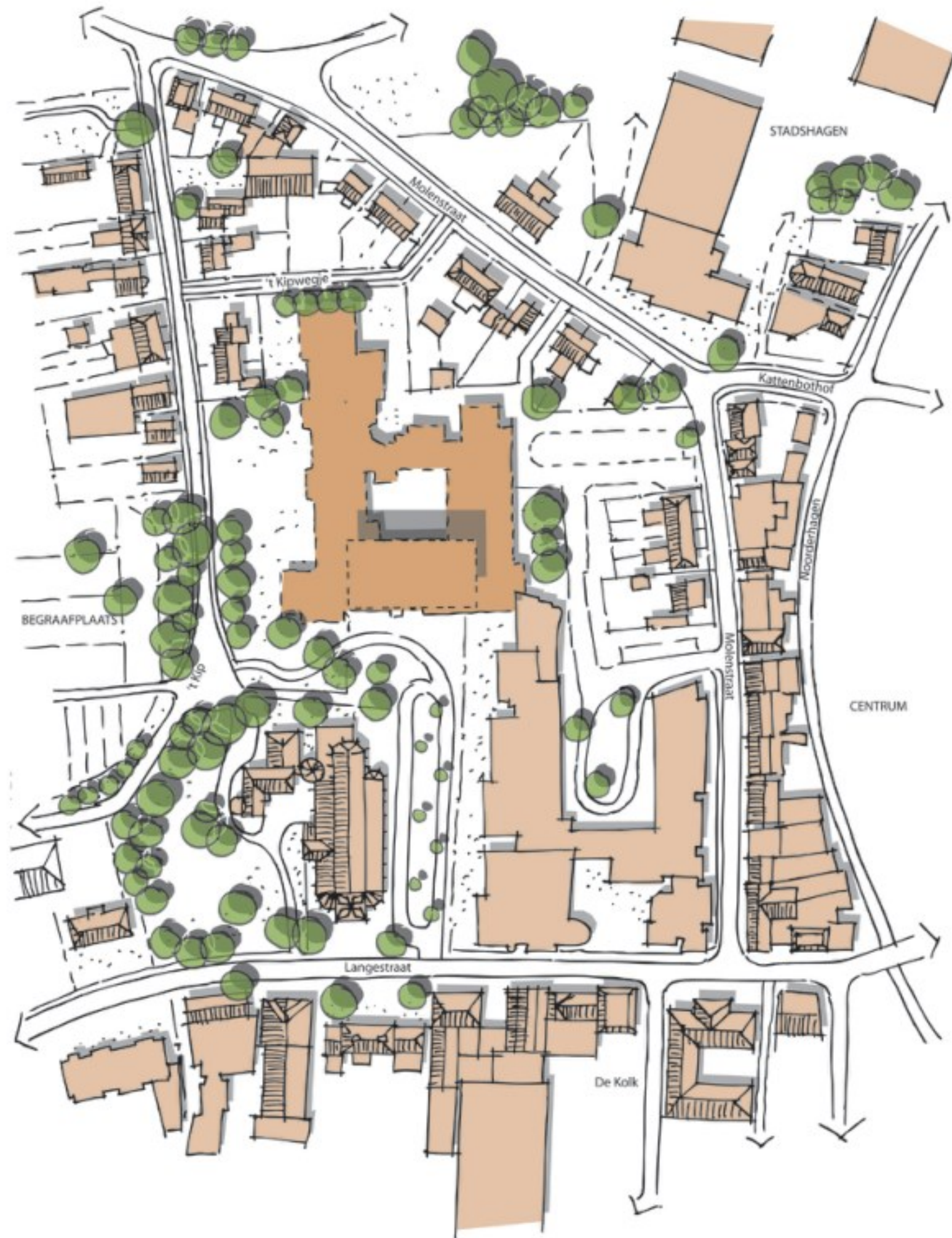
Het plangebied met weergave van het huidige gebouw St. Elisabeth