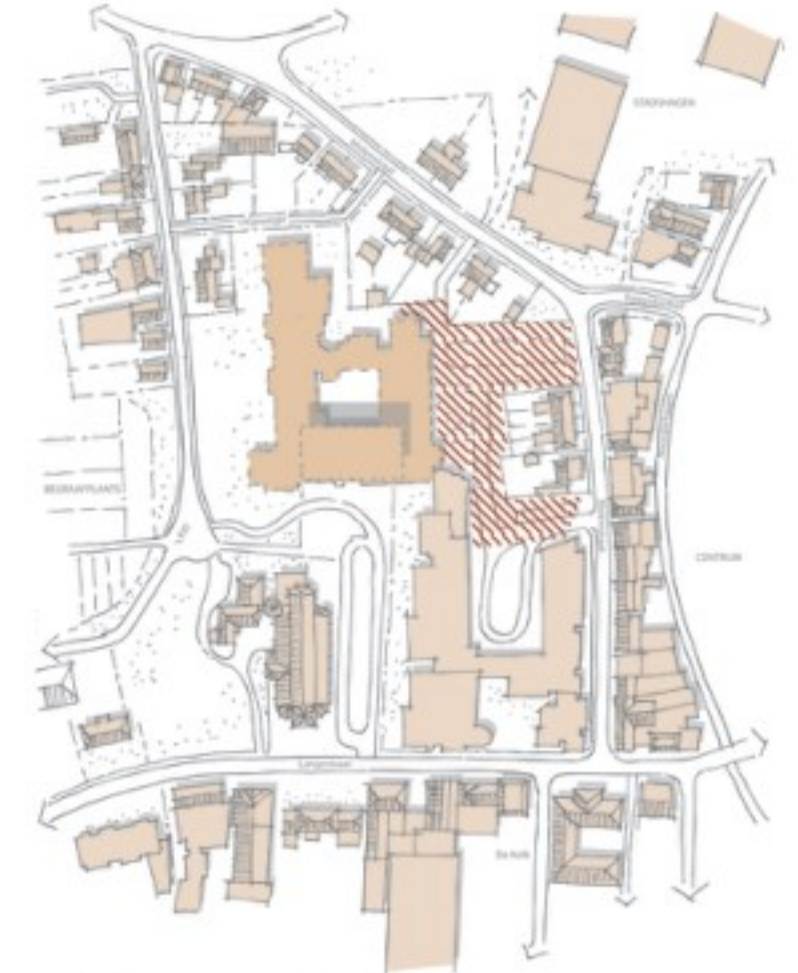
Gebrek aan samenhang in de openbare ruimte. Met name tussen Molenstraat en het huidige gebouw is sprake van weinig eenheid in de openbare ruimte. Dit resulteert in een rommelig beeld.