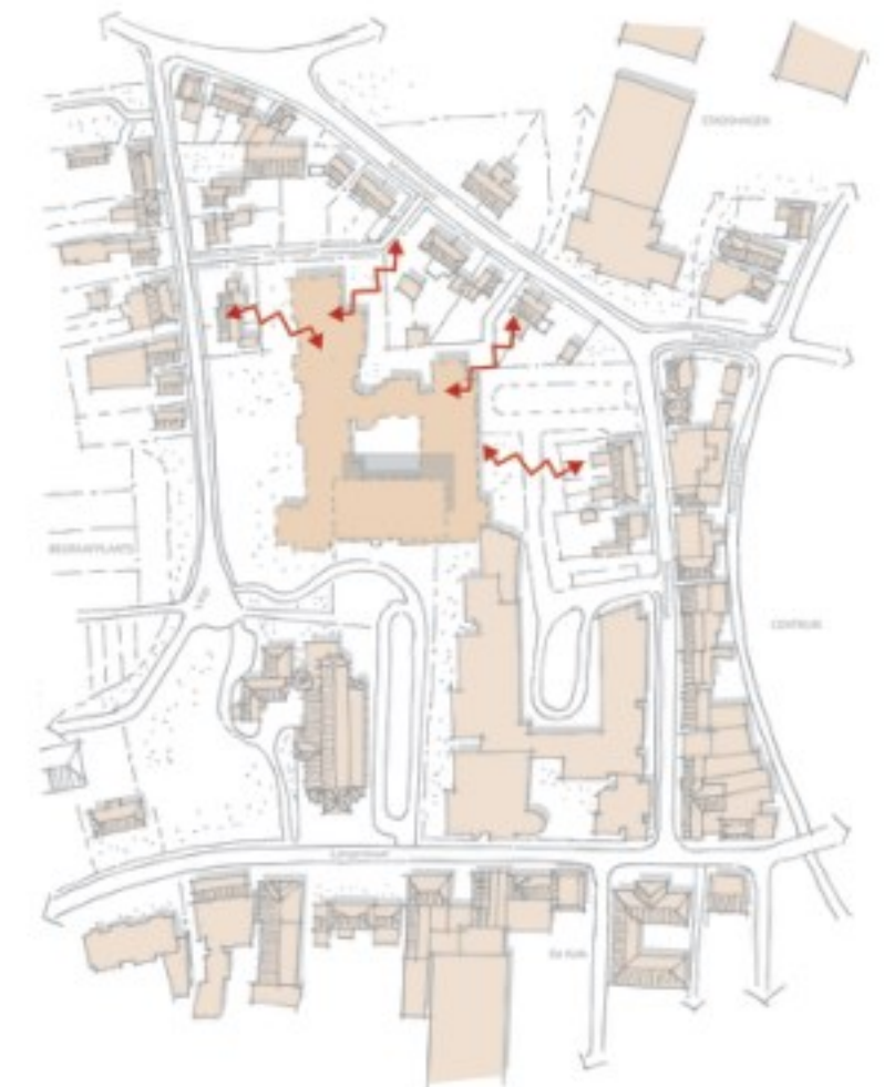
De inpassing van het gebouw in zijn omgeving is niet overal even goed. Dit heeft te maken met verschillen in maat en schaal en een anonieme en intern gerichte uitstraling. Dit speelt met name aan de noord- en oostzijde.