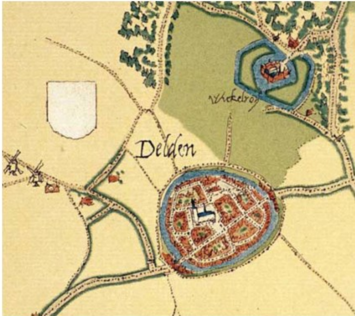
Delden in 1566, Jacobus van Deventer