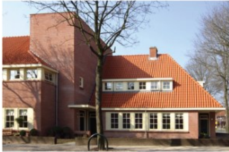
De entree naar het gebouw en het binnenhof wordt benadrukt door accenten i.d. hoofdmassa