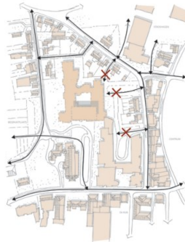
De fijnmazige wegen- en padenstructuur die kenmerkend is voor het (historische) omgeving wordt onderbroken t.p.v. het huidige verzorgingshuis.