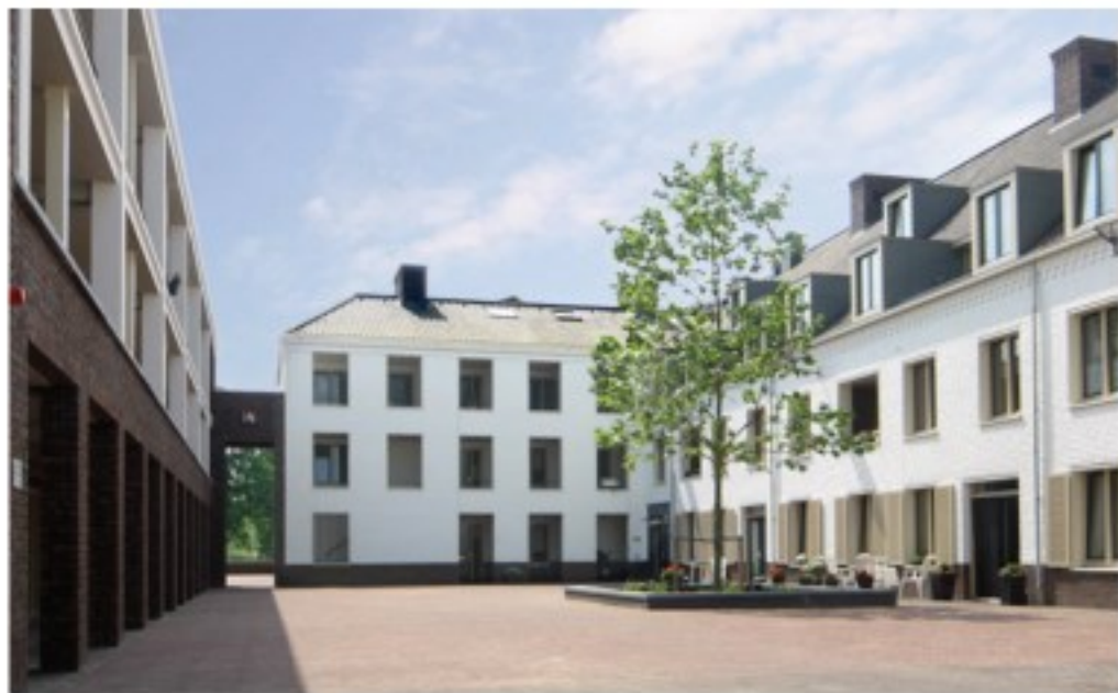
De architectuur refereert aan de historische bebouwing in de omgeving (kerk, klooster, raadhuis). De gevel heeft een verticale geleiding. Het binnenhof vormt een eigen wereld en dit komt tot uitdrukking in de architectuur.