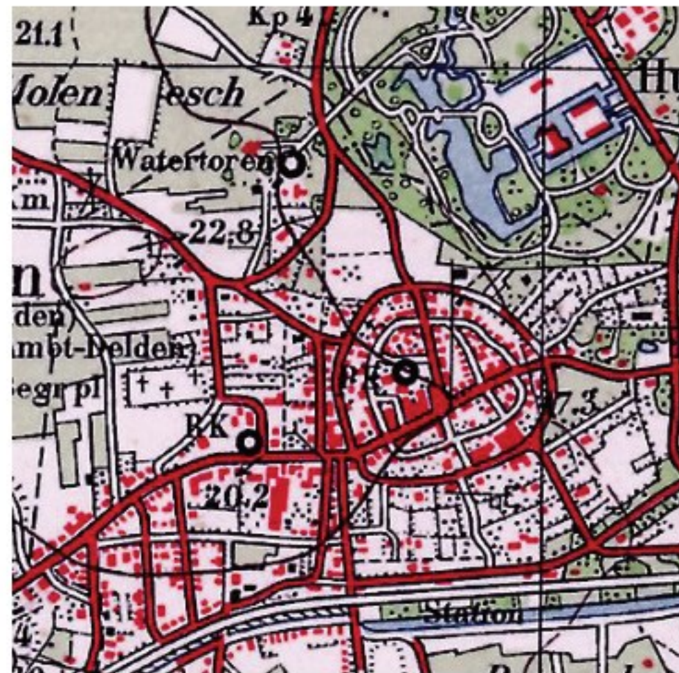
Delden in 1935