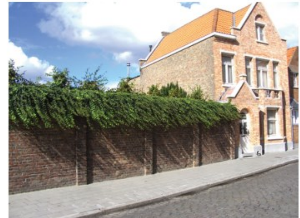
Duurzaam gebouwde erfafscheidingen, passend in de historische context