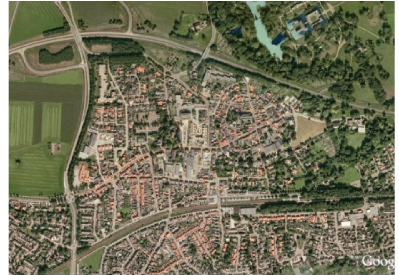
Luchtfoto van Delden (boven) Structuurbeeld van Delden (onder) met de historische kern, de oude wegen, de centrumschil (groen) en de projectmatige woningbouw (oranje)