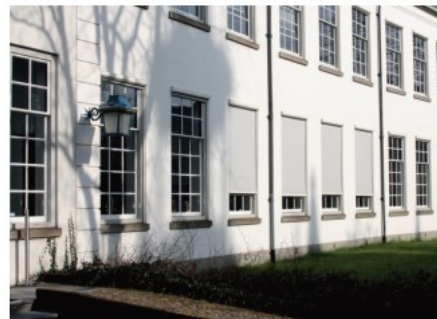
Zonwering maakt integraal onderdeel uit van het ontwerp van het gebouw