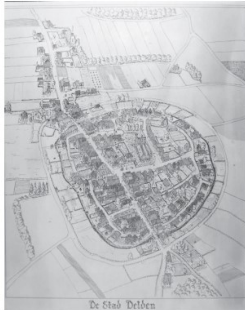
Vogelvluchtschets van Delden in 1832, met voorloper van de huidige katholieke kerk die parallel stond aan de Langestraat