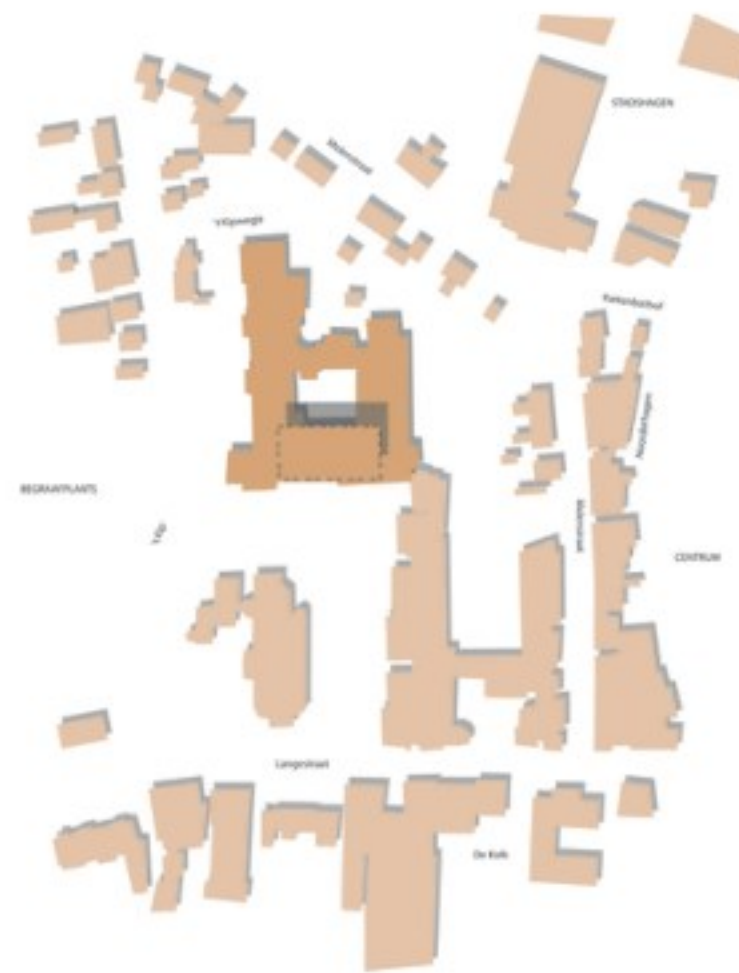
De korrelgrootte van de bebouwing. Het gebouw sluit in maat en schaal niet goed aan op de (historische) gebouwen in de omgeving.