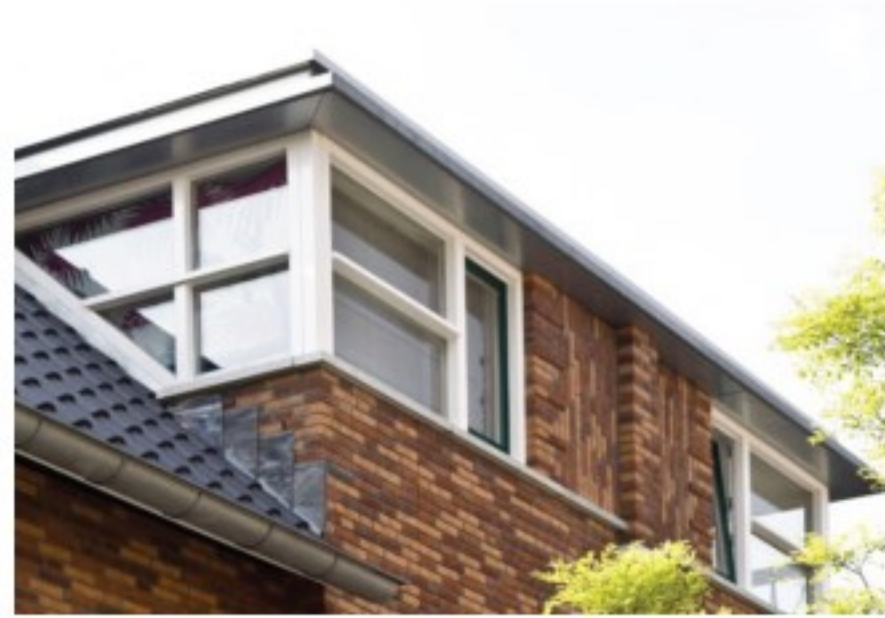
Aandacht voor de detaillering, eigentijds maar met ambachtelijke uitstraling