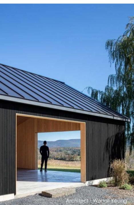
Architect : Worrell Yeung