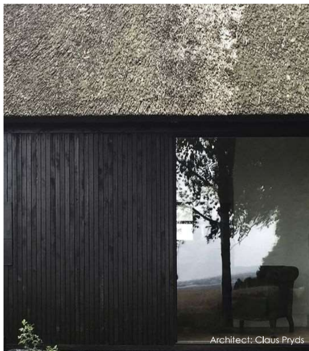
Architect: Claus Prys

Het materiaal en kleurgebruik van de nieuwe te bouwen woning is een belangrijk onderdeel in de beeldkwaliteit.