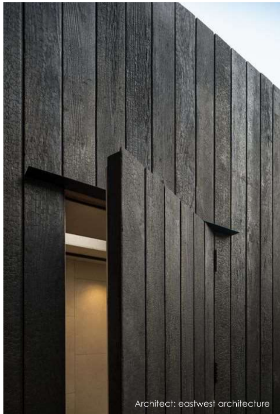
Architect: eastwest architecture