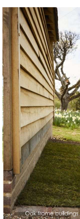
Oak frame buildings

De aangegeven sfeerbeelden geven een globale weergave weer van de verfraaiing van de bestaande schuur op het erf.