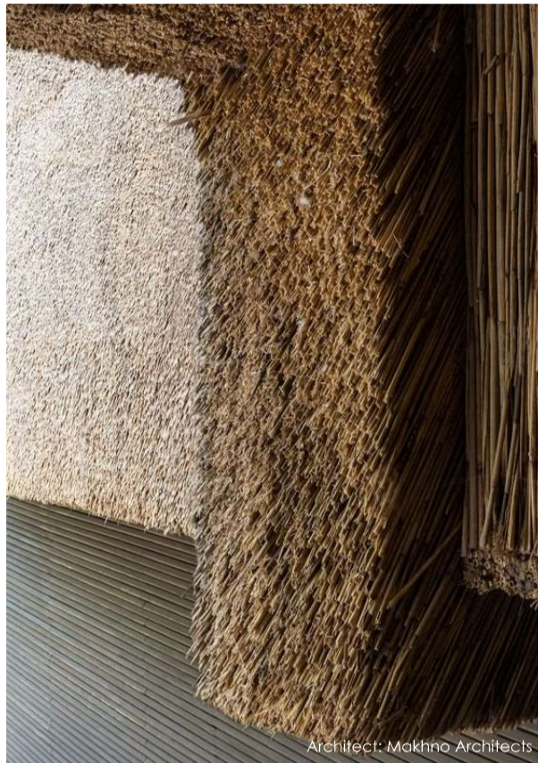
Architect: Makhno Architects