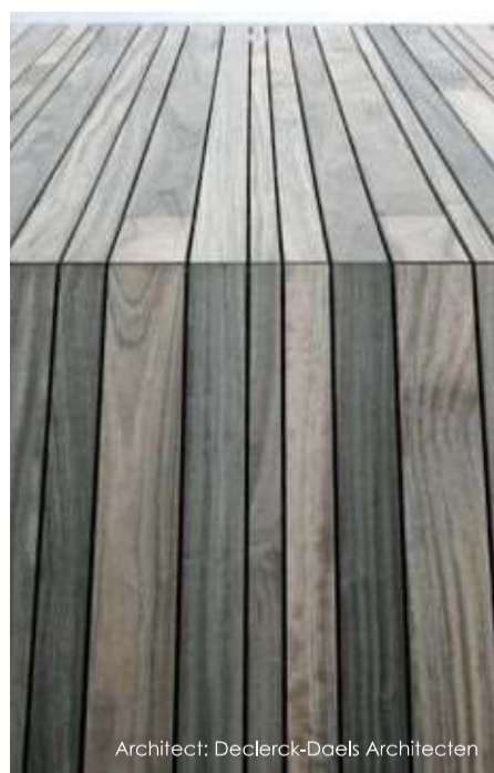
Architect: Declerck-Daels Architecten