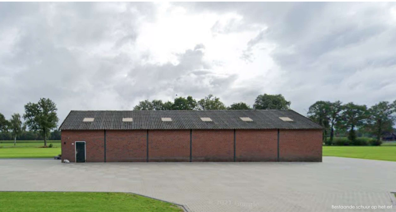
Bestaande schuur op het erf