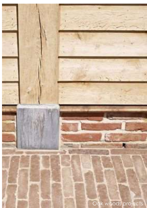
Oak woods projects