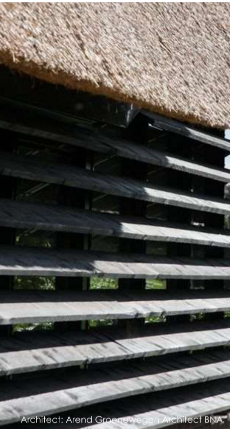
Architect: Arend Groenewegen Architect BNA