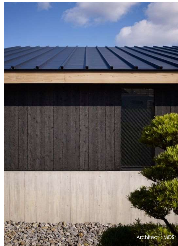
Architect : MDS