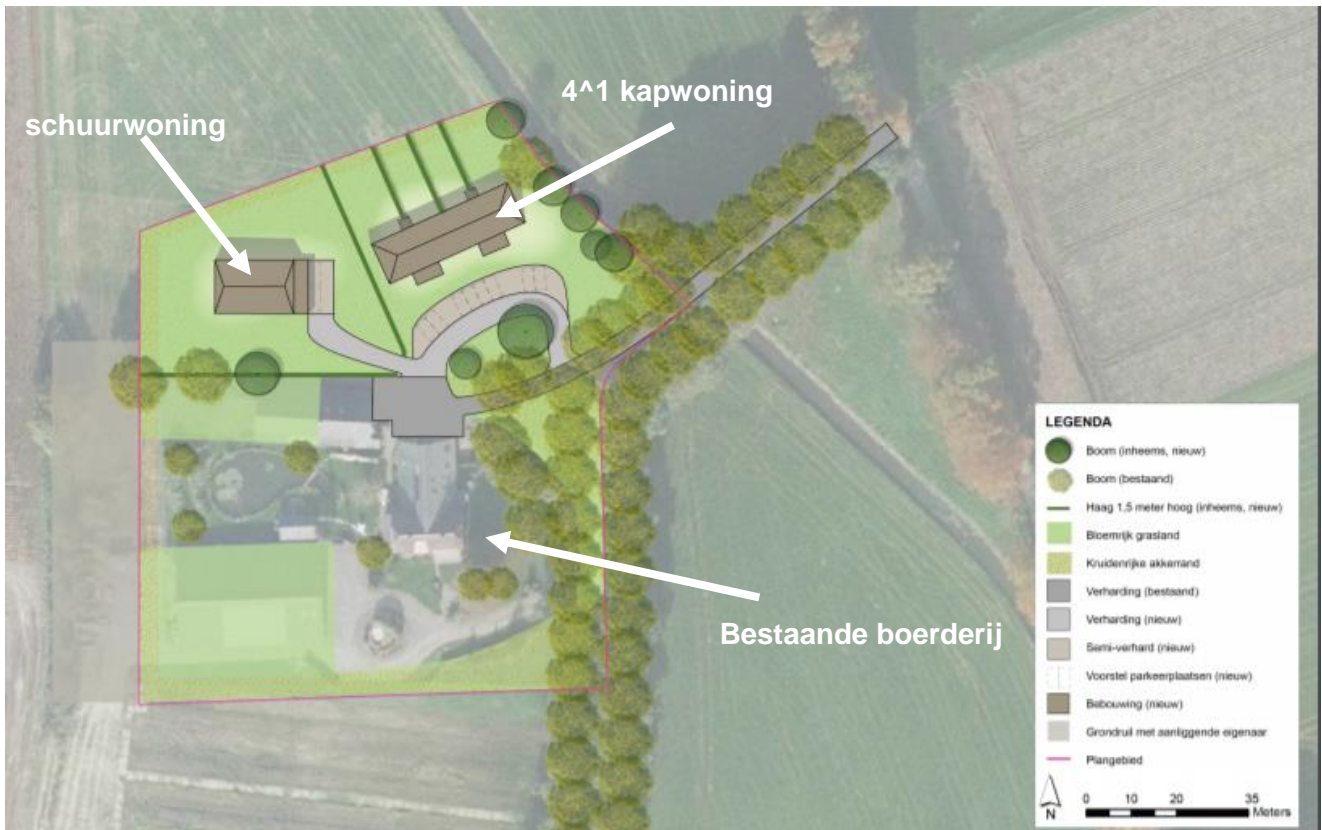
Afbeelding 1 situering nieuwe erf

Het perceel Kleidijk 4 te Diepenheim ligt qua welstandsbeleid in het gebied 'kampen en essen'. De gemeente heeft voor dit deel gebied welstandscriteria opgesteld. Doel van de regels voor dit deelgebied is om de karakteristieke vervlechting van de bebouwingsensemble met het omliggende landschap te behouden en te versterken. In de vormgeving en gevelbehandeling voegt de nieuwbouw van 5 woningen in 2 volumes zich op een aantal essentiële punten naar de bestaande kenmerken. De nieuwe bebouwing en het landschap moeten een eenheid vormen.