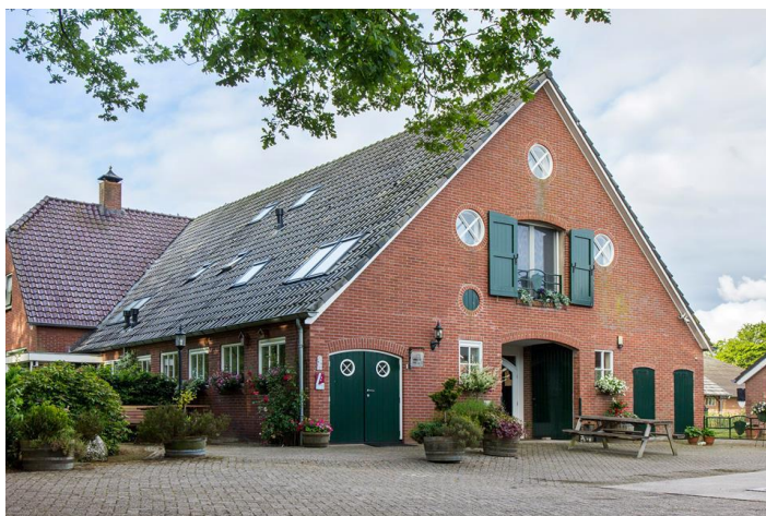
Afbeelding 2 bestaande boerderij met B&B op de voormalige deelruimte

De welstandscriteria worden hieronder benoemd gelden voor de te realiseren nieuwe gebouwen op het perceel Kleidijk 4 Diepenheim. Deze criteria worden door de gemeenteraad vastgesteld als aanvulling op de welstandsnota. Hiermee vormen de criteria het kader voor de toetsing van bouwplannen aan de redelijke eisen van welstand. Als het plan is gerealiseerd, treedt het regiem van 'kampen en essen' in werking. Bij de ontwikkeling van het erf is het van belang dat bij de 4^1