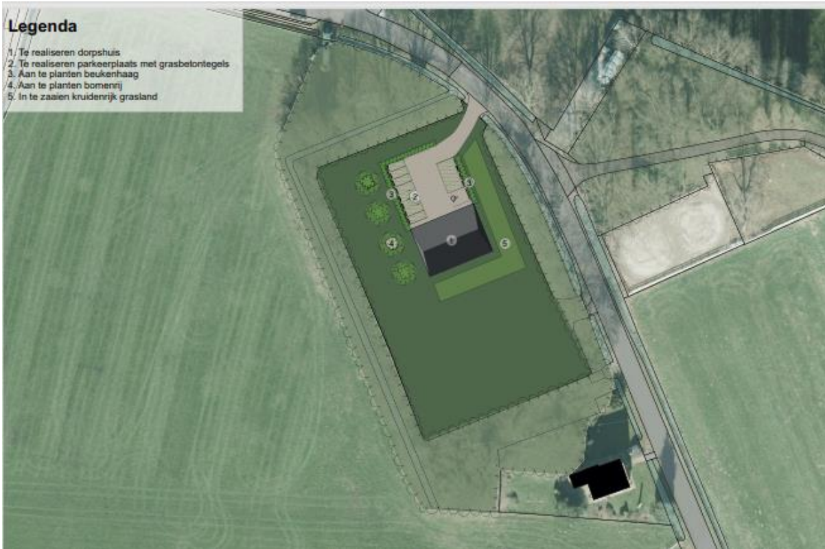
Afbeelding 1. Erfinrichtingsplan nieuw erf (geeft een richting, is nog niet vaststaand).

Het perceel Oude Deldensestraat 2b Diepenheim ligt qua welstandsbeleid in het gebied 'kampen en essen'. De gemeente heeft voor dit deelgebied welstandscriteria opgesteld. De nieuwbouw van het buurthuis en eventuele bijgebouwen sluiten qua verschijningsvorm en positionering aan bij de gebiedskenmerken en het erf. De nieuwe bebouwing en het landschap moeten een eenheid vormen.