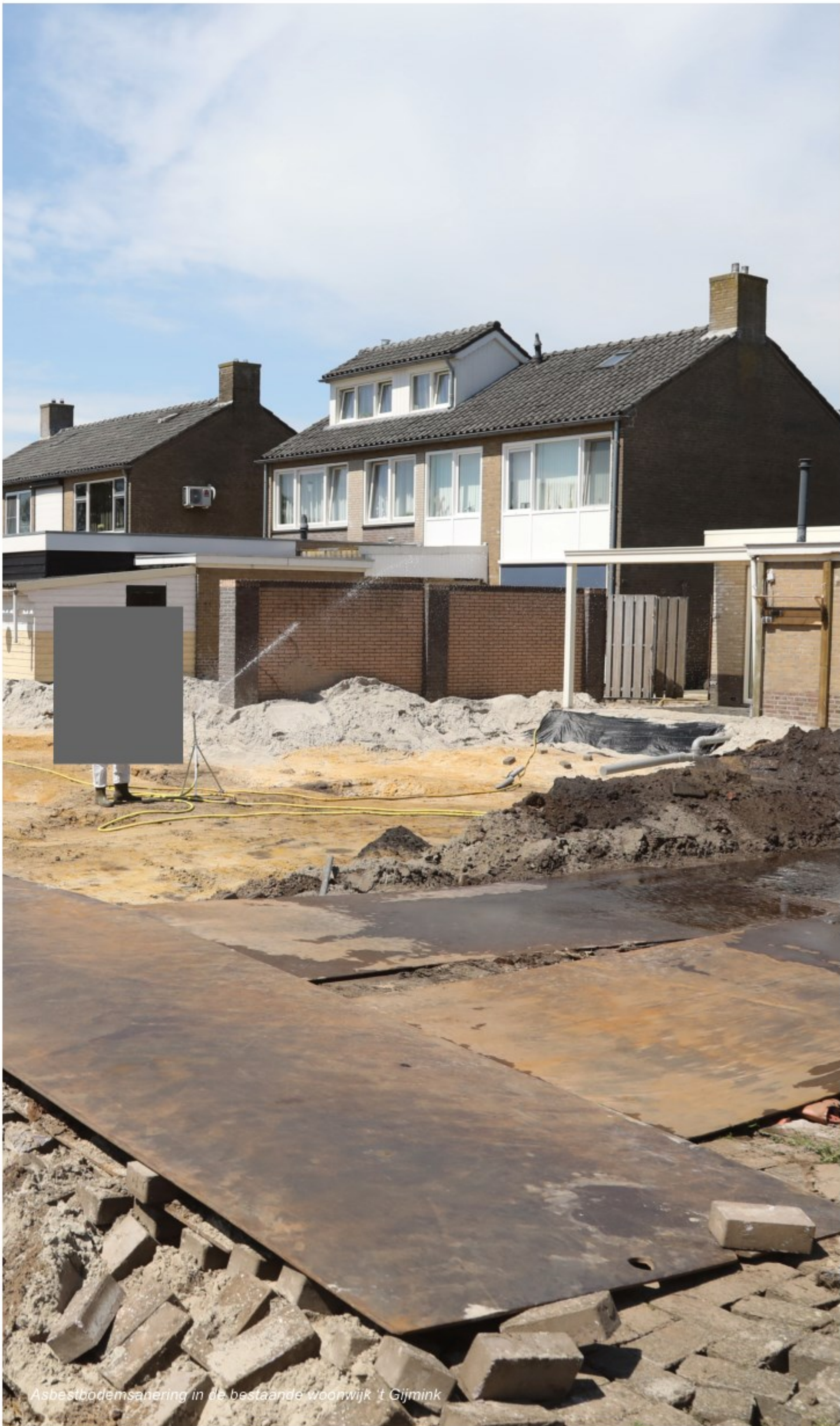
Asbestbodemsanering in de bestaande woonwijk 't Gijmink