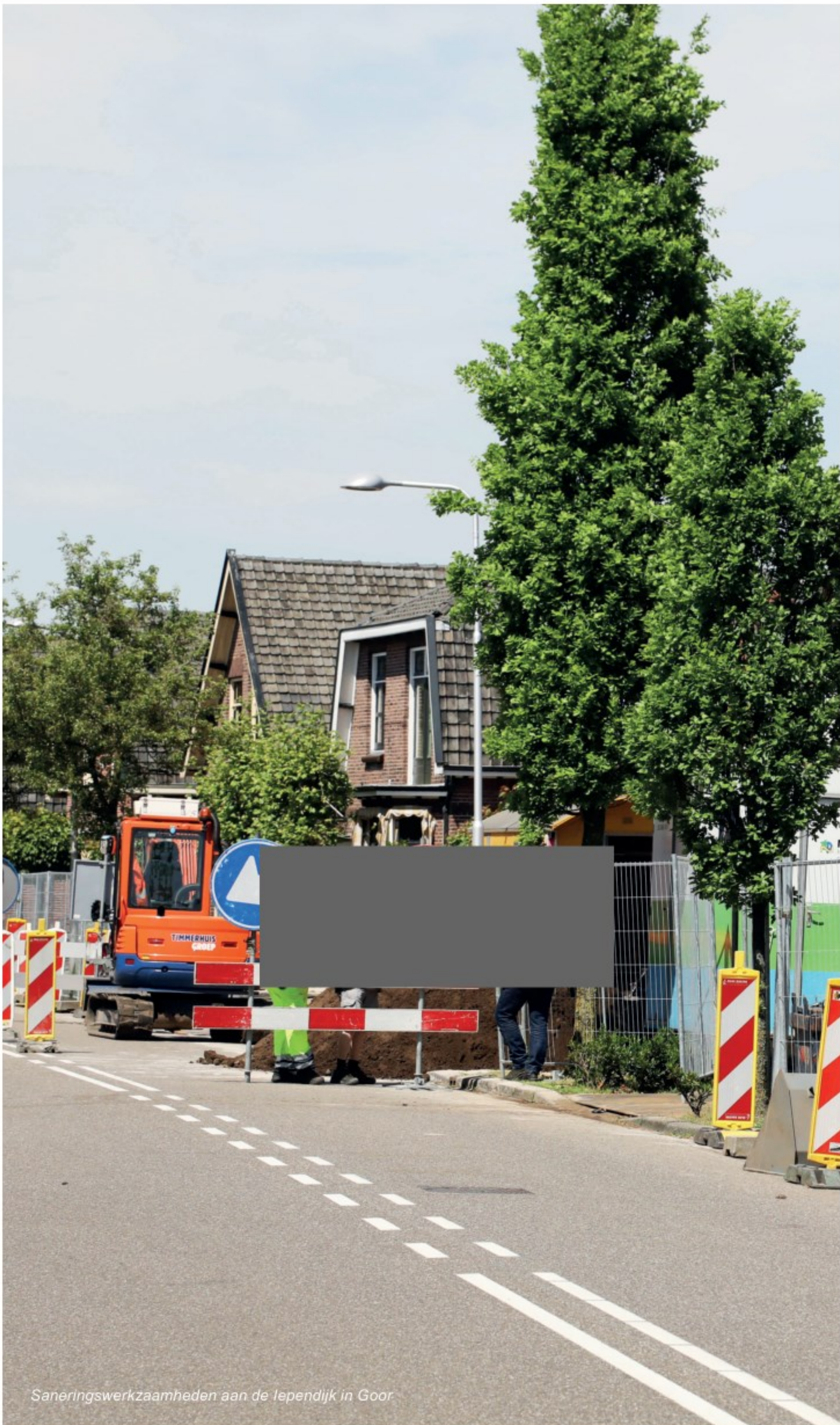
Saneringswerkzaamheden aan de Iependijk in Gooor