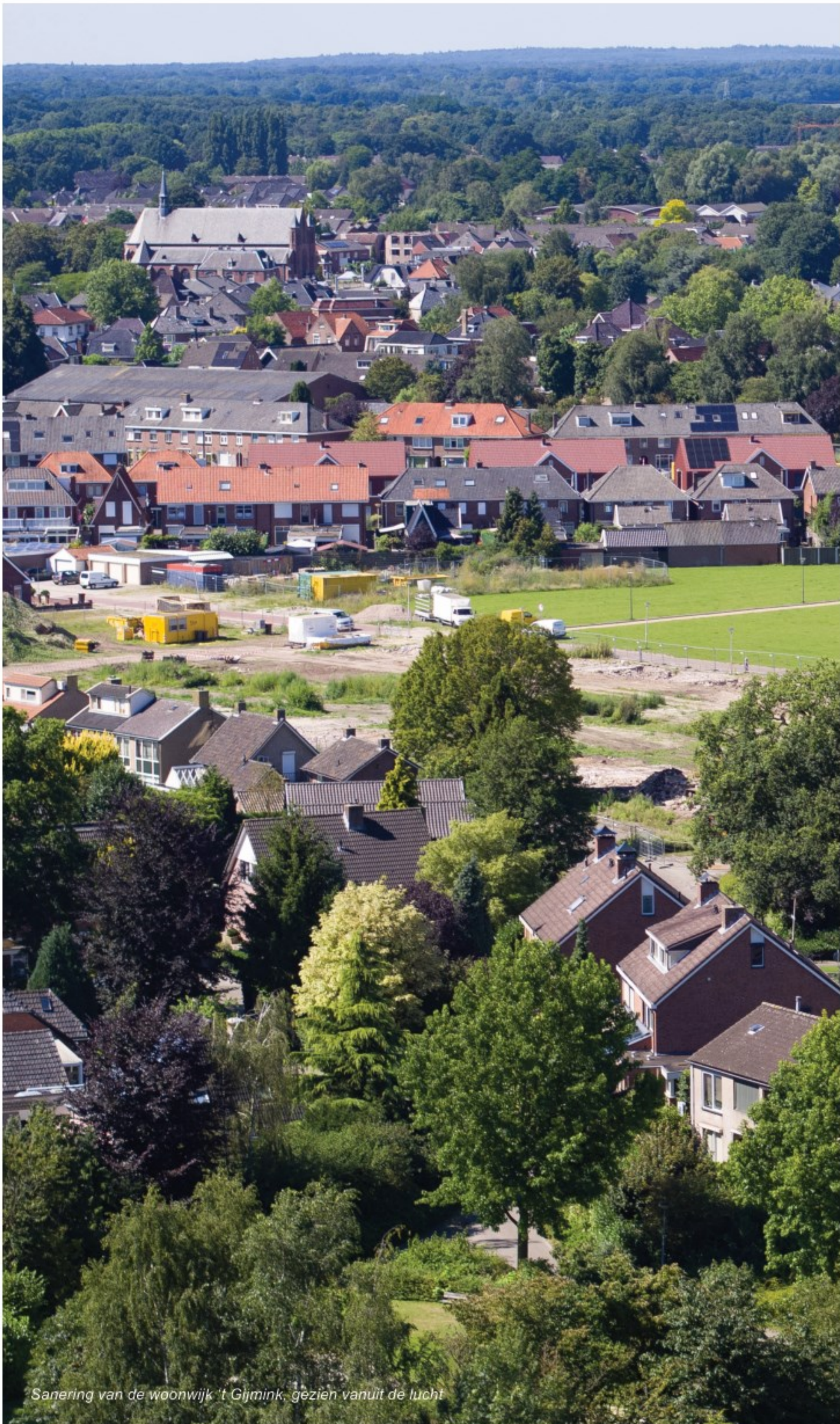
Sanering van de woonwijk 't Gijmink, gezien vanuit de lucht