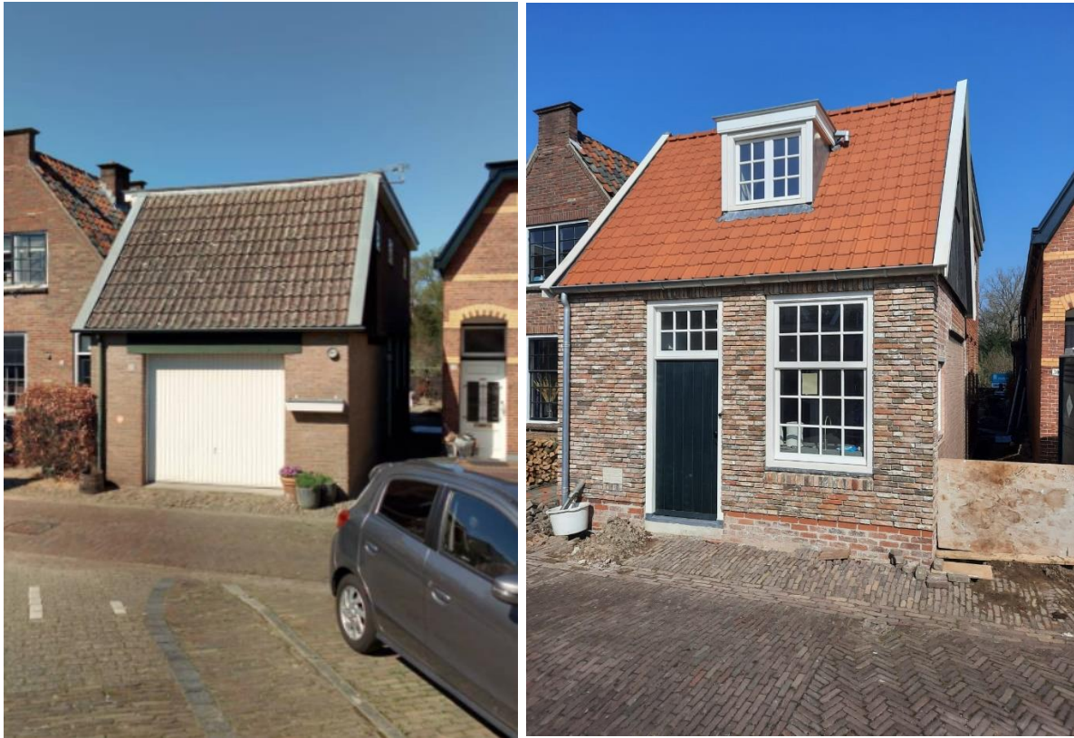
Restauratie van een pand aan de Noordwal 32 in Delden (links de bestaande situatie en rechts de nieuwe situatie).