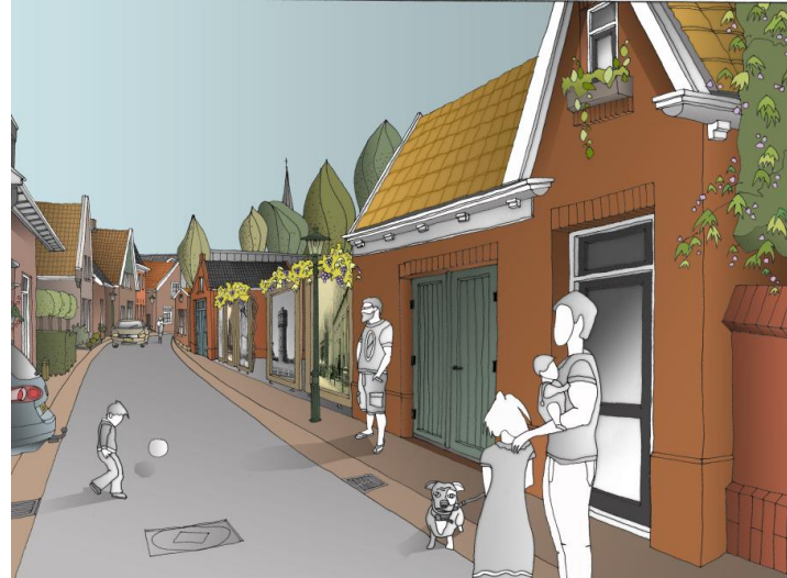
De Zuidwal in de richting van de achterzijde van de HEMA