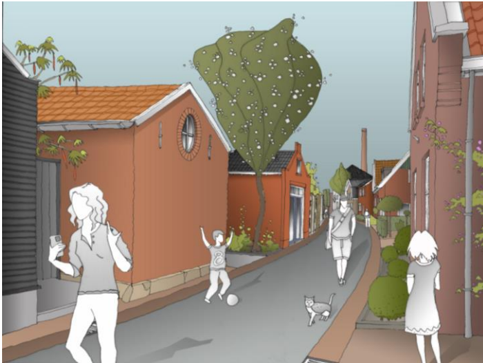
Links bij het spelende jongetje het inmiddels ingestorte schuurtje aan de Zuidwal