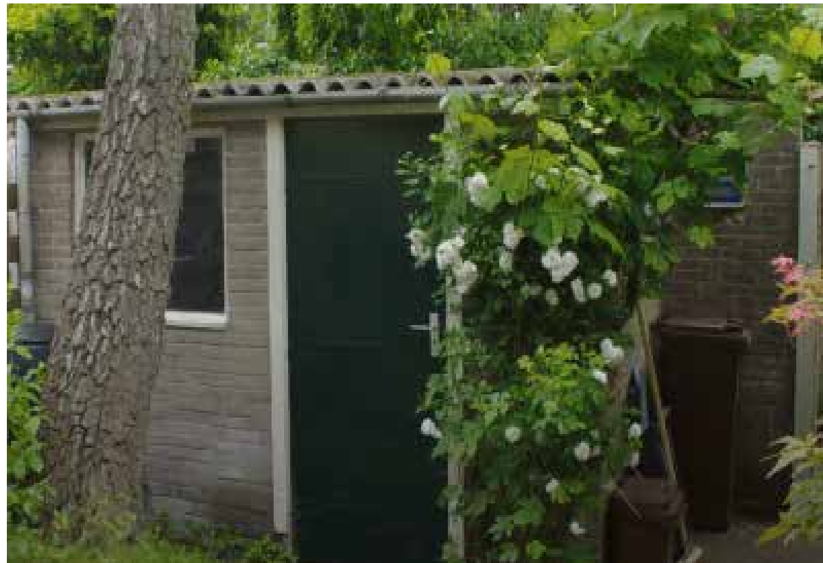
Heeft u een dak van asbestplaten op uw schuurtje? Verwijder het samen met uw buurtbewoners!

Van 13 tot en met 19 september 2021 is het de Week van de Asbestvrije Schuur. In die week organiseren wij speciale acties voor het verwijderen van kleine asbestdaken. In de wijken De Whee en Heeckeren in Goor gaan buurtbewoners samen asbestdaken van hun schuurtjes verwijderen. De gemeente zorgt voor beschermende kleding en verpakkingsmateriaal en speciaal in deze actieweek ook voor de sloopmelding en afvoer van het asbest.