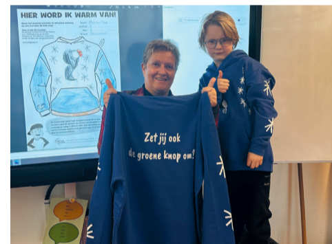
Mex ten Thije van de Petruschool in Hengevelde