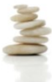
Platform IVZ Twente

Deze folder is tot stand gekomen in samenwerking met: