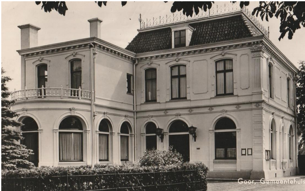
Gemeentehuis aan de Diepenheimseweg 1