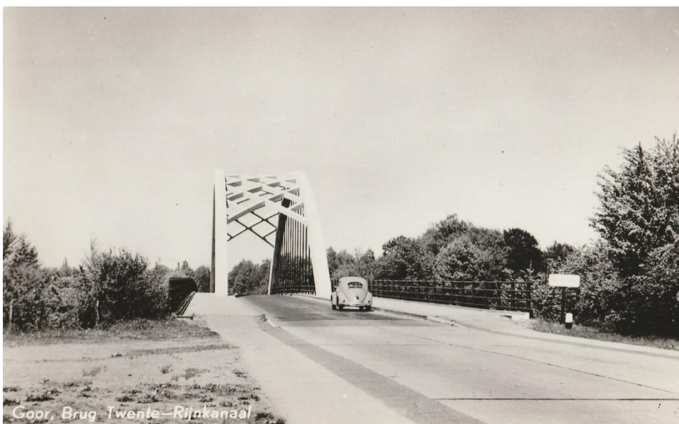
Hengelerbrug over het Twentekanaal

In de jaren '30 werd het Twentekanaal aangelegd. Het grootste deel is aangelegd als werkverschaffingsproject tijdens de crisis en door werklozen met de schop gegraven. In 1938 was het kanaal gereed.