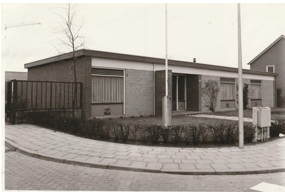
Kantoorgebouw van de Dienst Gemeentewerken aan de Patrijzenstraat 1

Door de groei van de gemeente neemt de omvang van het gemeentelijke apparaat en daarmee ook de Dienst Gemeentewerken navenant toe. De huisvesting in het pand aan de Diepenheimseweg 1 groeit wederom uit zijn jasje. De Dienst Gemeentewerken vertrekt uit het gemeentehuis en op 29 maart 1968 wordt een nieuw pand bestaande uit kantoren, werkplaats en garages aan de Patrijzenstraat 1 in gebruik genomen.