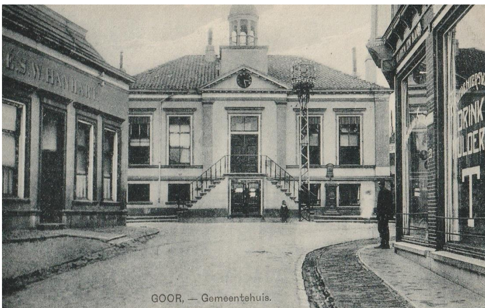
Gemeentehuis aan de Voorstraat 1